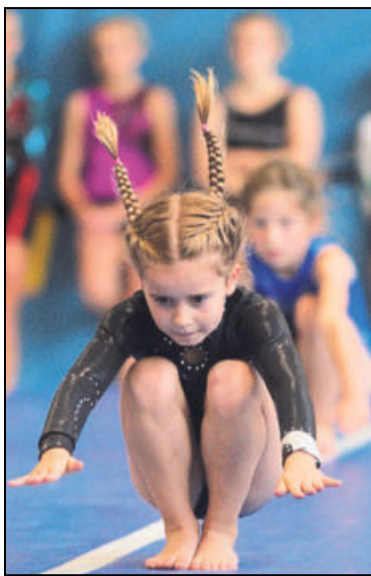
Auch der Zopf bewegt sich beim Purzelbaum: Die Jüngsten sind erst sechs Jahre.