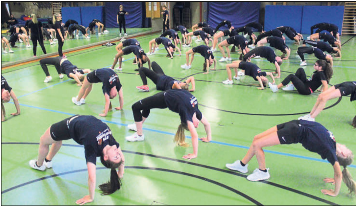
Beweglich: Bevor sie mit dem Training beginnen, dehnen sich die Cheerleaderinnen ausgiebig. Im großen Spiegel können sie sich bei den Übungen selbst beobachten.