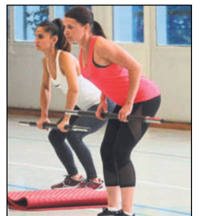
Auf die Haltung kommt es an: Diese Sportlerinnen wärmen sich auf.